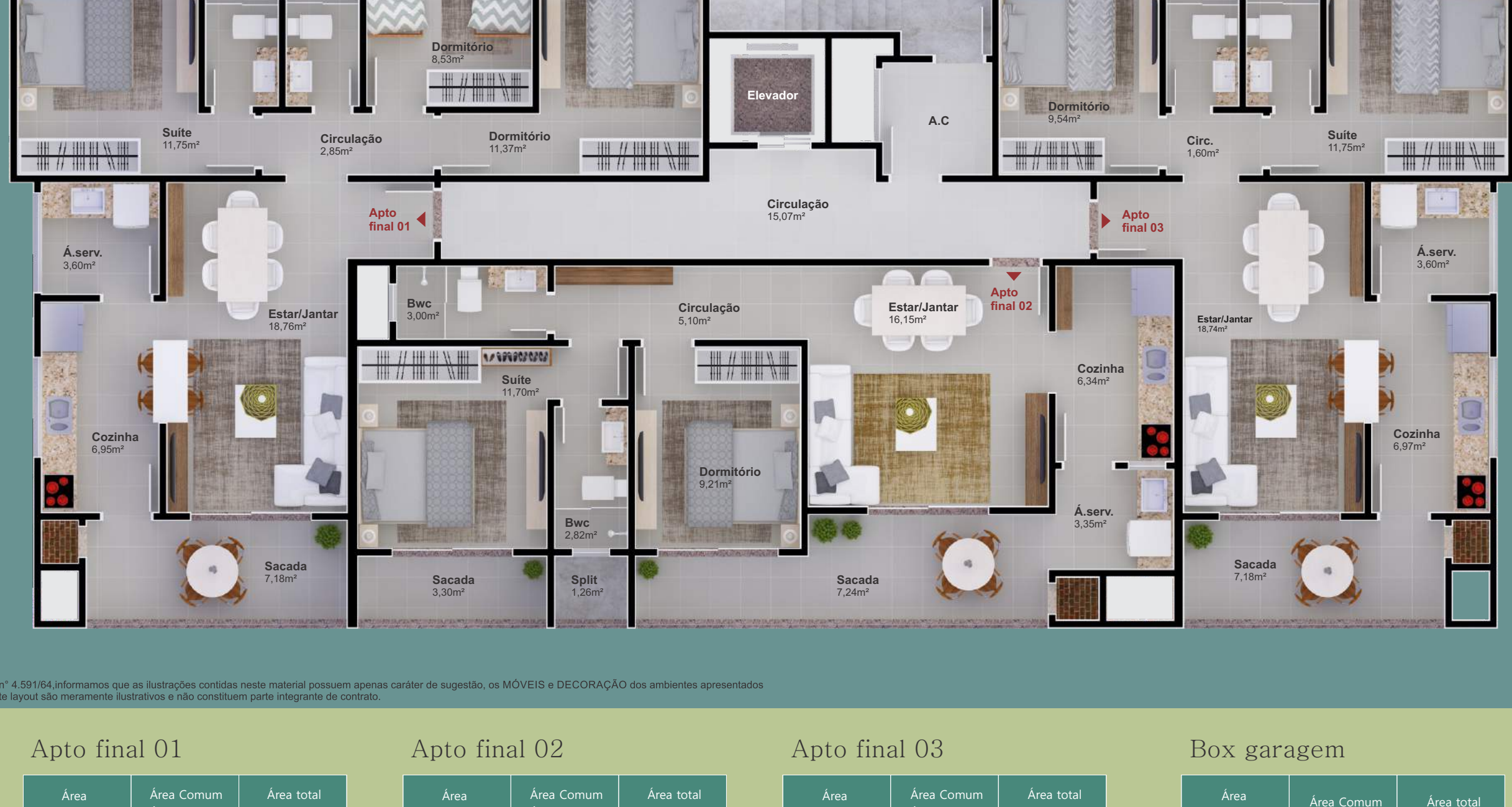
Apto final 01